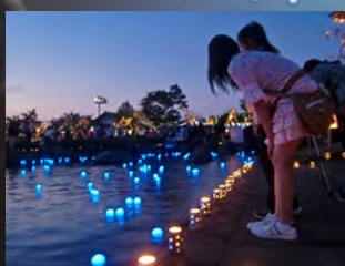
いのり星® イメージ